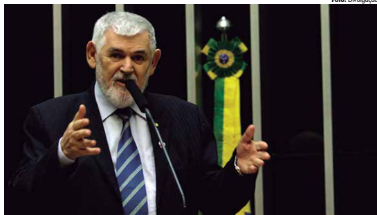
Segundo o deputado, o aparato estatal tem sido amplamente utilizado para perseguir e destruir a imagem de adversários