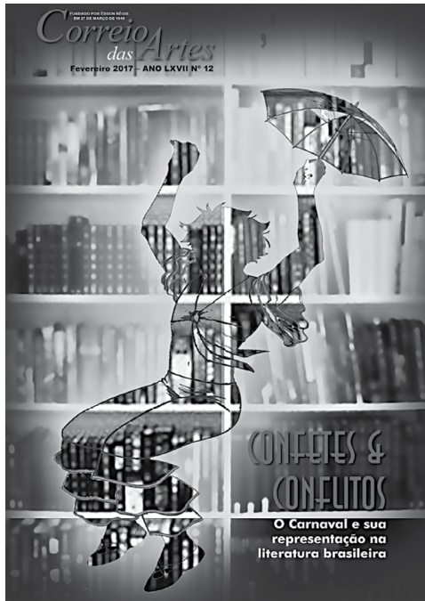
Suplemento literário mensal do jornal A União é uma publicação para os amantes das letras