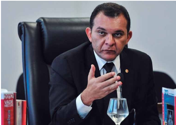
Na eleição, 50 membros do MPPB registraram seus votos através do sistema online, tendo o procurador-geral obtido 47 votos

Na eleição, 50 membros do MPPB registraram seus votos através do sistema online, tendo o procurador-geral obtido 47 votos, dois votos foram brancos e um nulo.