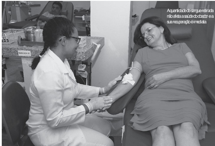
A quantidade de sangue retirada não afeta a saúde do doador e a sua recuperação é imediata.

Para doar o candidato precisa ainda apresentar um documento de identidade original, com foto, válido em todo o território nacional. Todos os critérios para doação de sangue são regulamentados pelo Ministério da Saúde (MS) e cumprem princípios e diretrizes da Política Nacional de Sangue, Componentes e Derivados.