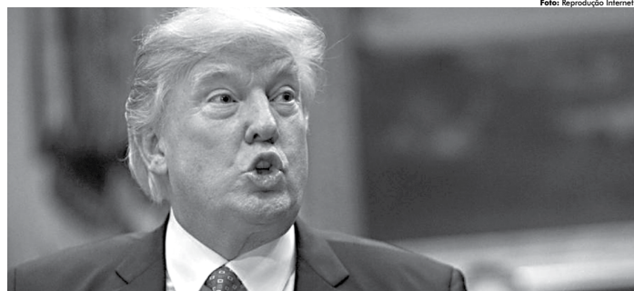
O presidente dos Estados Unidos, Donald Trump, fez a declaração durante participação na Conferência de Ação Política Conservadora