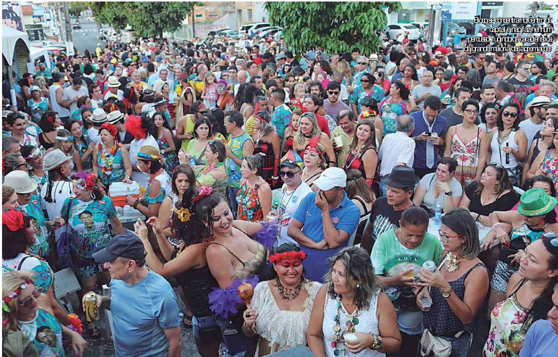
Bloco carnavalesco Centro de capital faz festa em João Pessoa para celebrar o aniversário da cidade e homenagear a garçagem das baianas