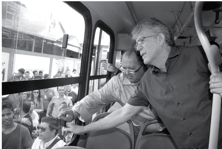
Governador Ricardo Coutinho visitou os ônibus e entrou que o prefeito de João Pessoa, a capital tinha uma das frotas mais jovens do Brasil

Ricardo Coutinho disse ainda que o Estado também está garantindo a continuidade da integração metropolitana, ou seja, quem toma