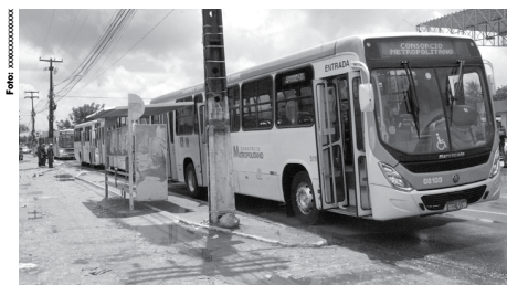
Ônibus integrados que o empresário já tinha em 31 ônibus nos semínios

A diretoria do DER articulou a criação do consórcio visando resolver de vez o grave problema do transporte público de Bayeux.